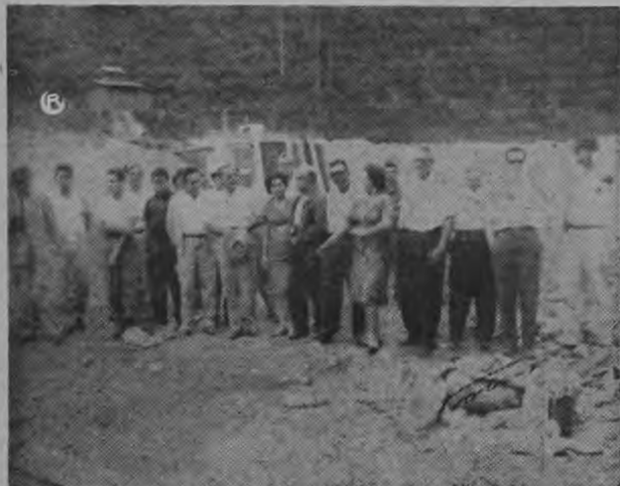
VISITA A RIO MACHO. El Gobernador, La Municipalidad y otras personas visitaron recientemente las obras que realiza el ICE en Río Macho. Regresaron sumamente complacidos al enterarse de que en junio se harán las primeras pruebas y muy posible en julio estará llegando el fluido eléctrico a Puntarenas.

A los otros peligros que entrañan las visitas al Volcán Irazú, se une ahora la de la saturación eléctrica. Para evitar resultados que pueden ser fatales, las personas que visiten el Volcán no deben hacerlo con zapatos de hule, para evitar el riesgo de que queden convertidos en acumuladores eléctricos de alta potencia.