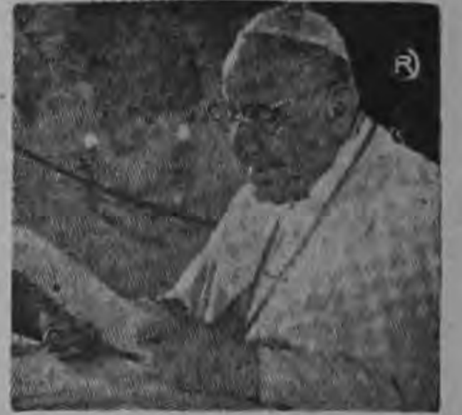
JUAN XXIII ...recibirá al mandatario norteamericano...

No ha sido decidido en donde se efectuará la reunión.