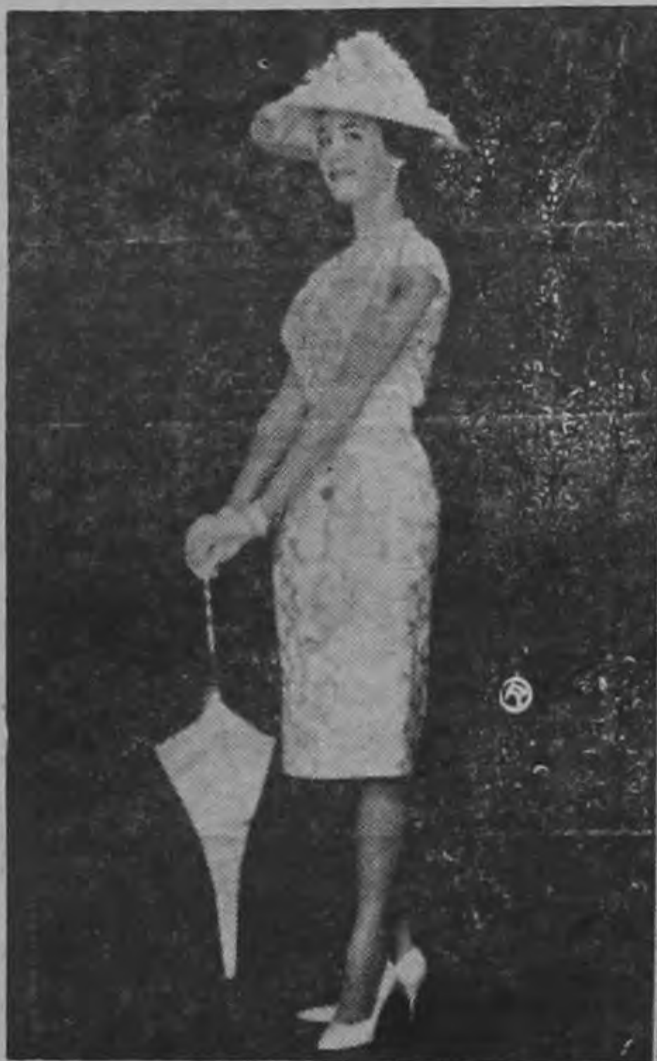
Precioso sombrero confeccionado en tul y flores delicadas de organdí de seda blanco. Ideal para asistir a las bodas o ceremonias diurnas. Lo luce Sandra Church, la encantadora coprotagonista de Marlon Brando en la película Universal - International, en color, "El Americano Feo".

Un sombrero de este estilo debe ser la nota destacada del atavío. Por tanto, deben usarse con vestidos muy simples y, principalmente, nada de joyas llamativas. Su belleza resaltará mucho más porque se concentrará en su rostro.