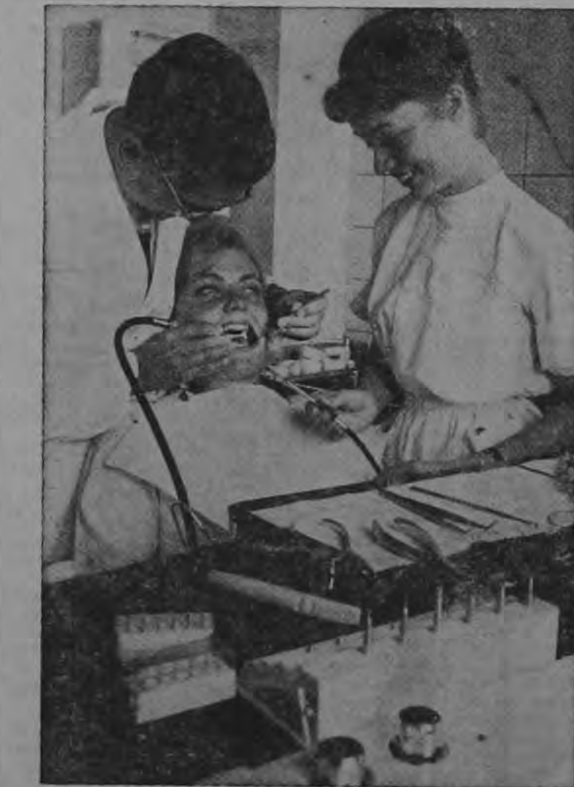
MAS DE 6.000 VISITANTES EXTRANJEROS SE CONGREGARON en el XIII Congreso Internacional de Odontología de Colonia. Se esperan de este congreso mundial, el más numeroso que ha tenido lugar hasta la fecha en suelo alemán, importantes conocimientos en todos los campos de la odontología. Además de conferencias científicas sobre nuevos métodos terapéuticos contra la parodontitis, el tratamiento de las malposiciones dentarias y la profilaxis del sarro, etc., se ha tratado también del problema del alivio psíquico y nervioso de los pacientes. A pesar de su desagradable zumbido, el torno de turbina neumática se ha revelado como un regalo de la ciencia para los pacientes agobiados de dolor. En razón al número de revoluciones, unas 350.000 por minuto, este aparato implica una disminución de la presión sobre el diente enfermo, y es manejado por el dentista como si llevara un pincel. Un chorro de agua pulverizada que brota durante la operación de diminutas espigas del aparato proporciona la necesaria refrigeración. La foto muestra un moderno gabinete de consulta de la clínica dentaria de la Universidad de Bonn. La paciente no nota este torno de turbina neumática más que durante unas fracciones de segundo y ya no se siente, como antes, "en una silla de tortura". En el primer plano se ven los conmutadores para la aspiración de aire y agua.