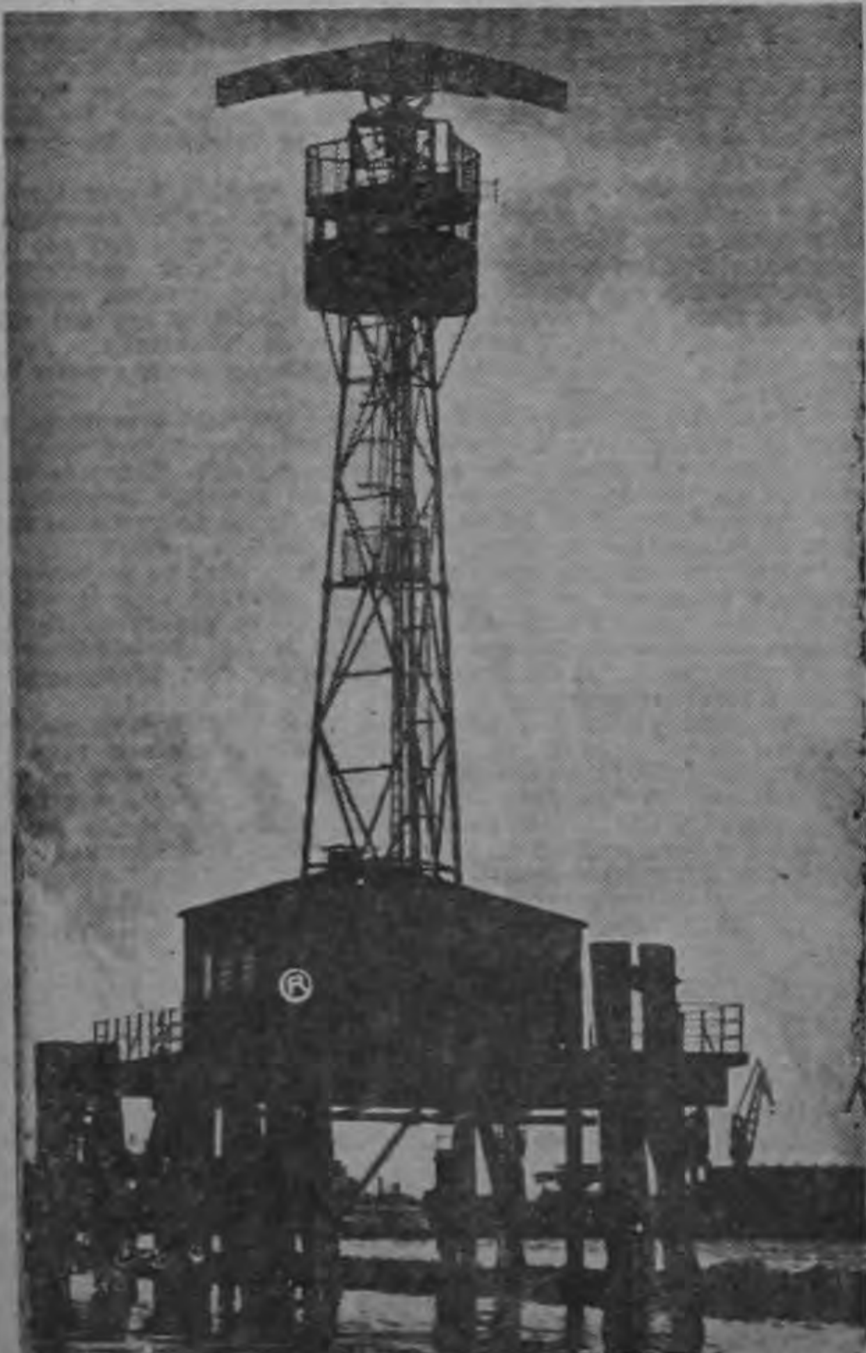
UNA DE LAS CINCO estaciones de radar en Hamburgo, que constituyen la garantía para la seguridad del movimiento de barcos en el mayor puerto alemán.

tructuración de la ODECA. Se estima ilógico discutir tal reglamentación si aún no ha sido aprobado el nuevo estatuto de la Odeca, es decir la ley constitutiva que se va a reglamentar. Varios países, entre ellos Costa Rica, no han ratificado los protocolos correspondientes a la nueva carta de la Odeca, aprobada en Panamá.