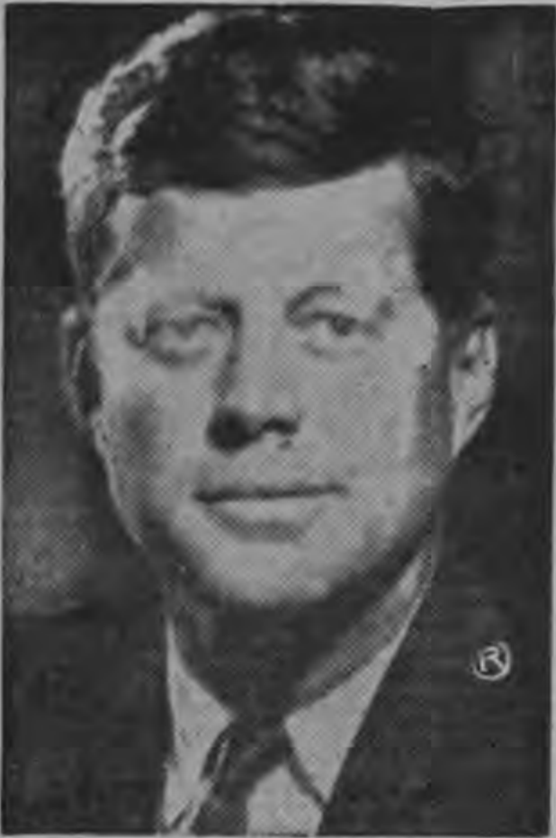
JOHN F. KENNEDY ...en su visita a Italia...